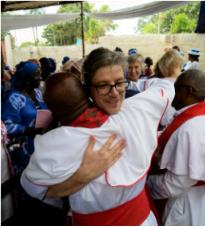
Profanes que nous avons formés. Quelle bénédiction !