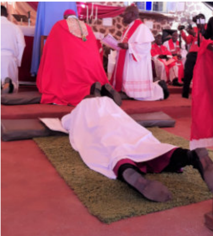
Le sermon correspondait parfaitement à la situation. Le diocèse de Bo a souffert, par le passé, à cause de